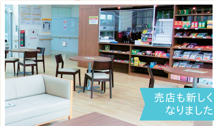
売店も新しく なりました