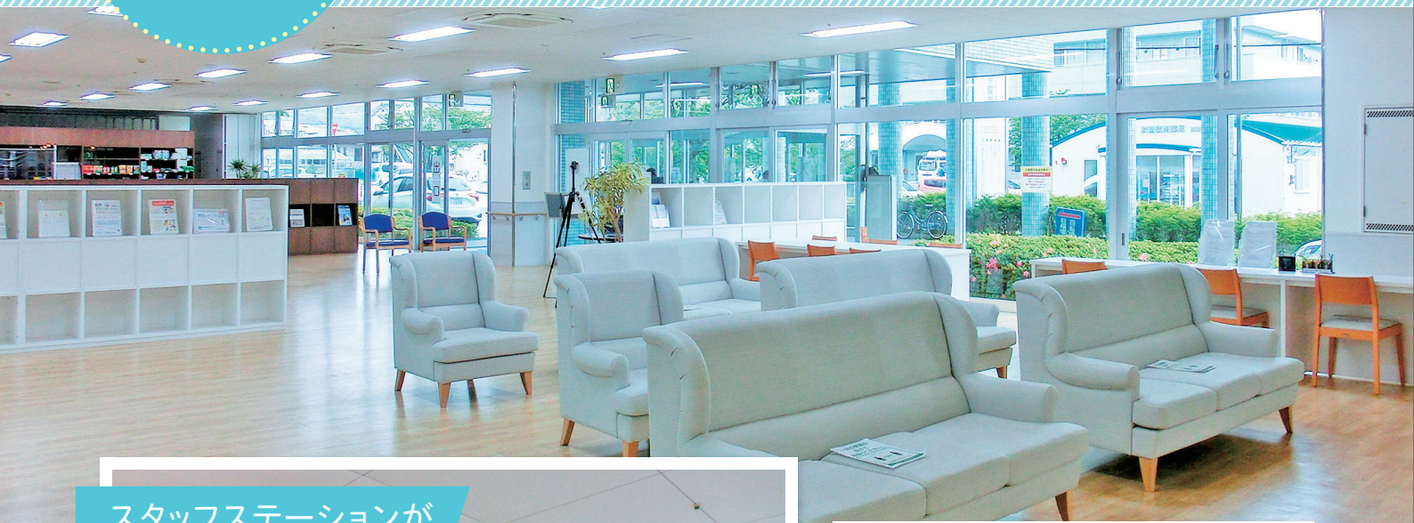
スタッフステーションが オープンカウンターに